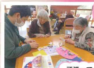
頑張って作りました!