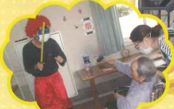
鬼がやってきました