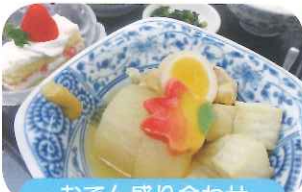
おでん盛り合わせ