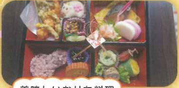
美味しいおせち料理をいただきました