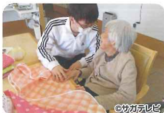
エプロンたたみのお手伝い。

色鮮やかな桜の開花が春の訪れを感じさせて くれ、令和3年度が始まりました。今年で桂寿苑 は創立40周年を迎えることができました。これ もひとえに桂寿苑を支えて頂いた皆様のおかげ です。これからも理念に沿ったサービス提供と 地域に根差した施設づくりを目指してまいりま す。1面でも紹介していますが40周年の節目に 記念誌を発行致しますので是非ご覧頂ければ幸 いでです。新型コロナウイルスがまたまた終息には遠 い状況ですが、凌友会全体で感染対策を講じな がら事業を進めていきたいと思っております。今年度 も宜しくお願い致します。