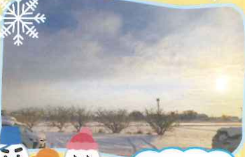
雪がたくさん積もりました