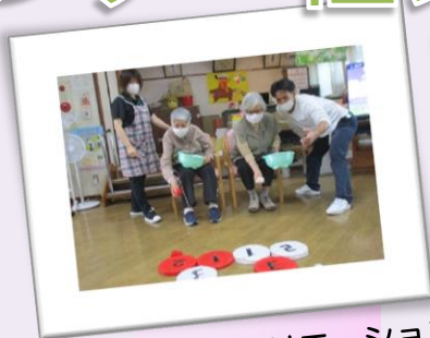
13:30 レクリエーション