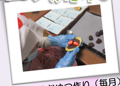
手作りおやつ作り (毎月)